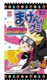
コラボ商品 エナジードリンク