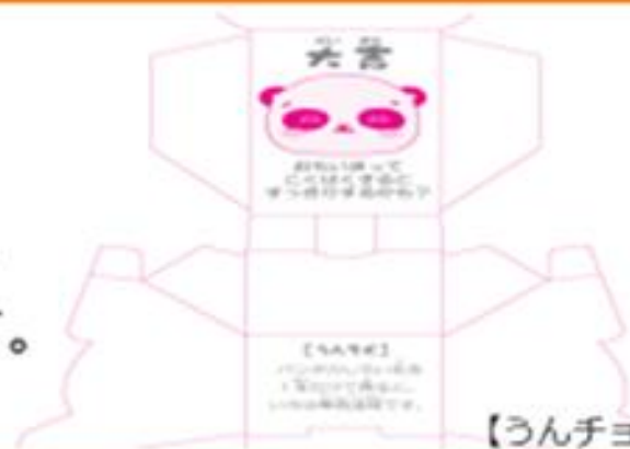
【うんチョコ裏面図】

うんチョコには 楽しいおみくじ と その動物に関するうんちく がついていて、食べながら楽しむことができます。